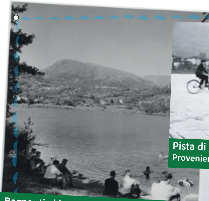
Bagnanti al lago di Origlio, 1957 circa.