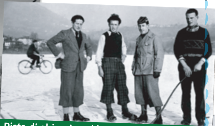
Pista di ghiaccio sul laghetto di Origlio.