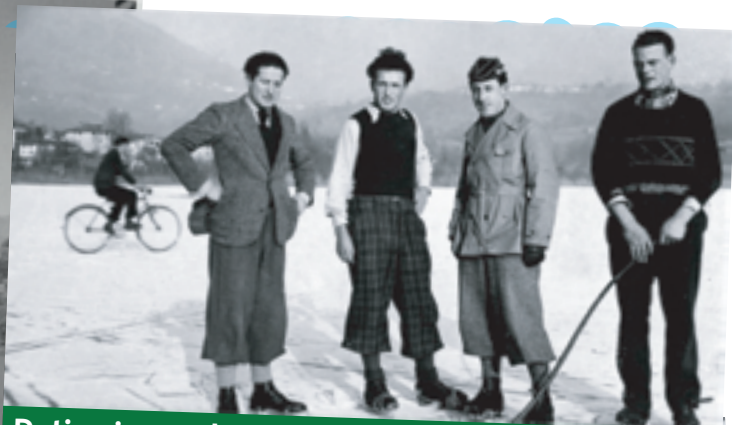
Patinoire au lac d'Origlio